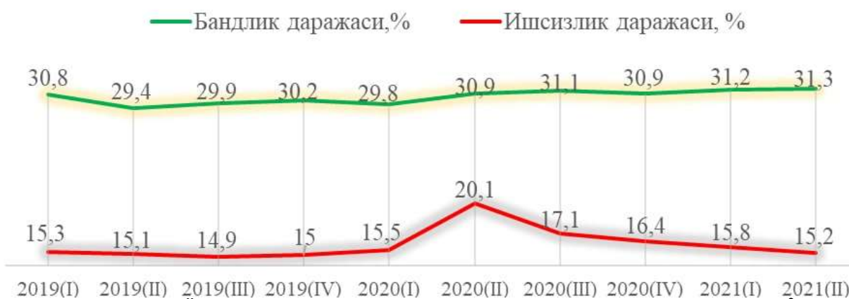
3-расм. Ёшларнинг бандлик ва ишсизлик кўрсаткичи динамикаси 2

2021 йилда меҳнат бозори, профессионал стандартлар, тармоқ малакалар доиралари ва малака талабларининг ишлаб чиқилиши ҳамда янгилаб борилиши, малака ва билимларни баҳолаш миллий тизимининг халқаро миқёсда тан олиншини таъминлаш мақсадида Касбий малака ва билимларни ривожлантириш бўйича тармоқ ва ҳудудий кенгашлар ташкил этилди. Covid-19 пандемиясининг иқтисодиётга салбий таъсирига қарамай, иқтисодиётнинг барқарор фаолият юритиши, аҳолининг даромад манбаи бўлган иш билан бандлигини сақлаб туриш, оммавий ишдан бўшатилишларни олдини олиш, ходимларни масофавий иш усулида бандлигини таъминлаш ва бошқа кенг чора-тадбирлар асосида ишсизлик даражасининг ошиб кетмаслигига эришилди (4-расм).