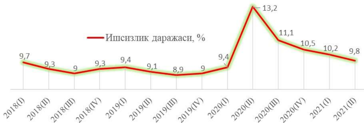
4-расм. Ишсизлик даражасининг ўзгариши динамикаси 1

Янги технологиялар электрон рўйхатга олиш, интеграциялашган ва автоматлашган ҳолда хизмат кўрсатиш сифатида инсон омили, унинг иштирокини имкон даражада камайтириб, иқтисодий бирликларнинг трансакцион харажатларини камайтиришга, иқтисодий фаолиятни расмийлаштириш имконини беради.