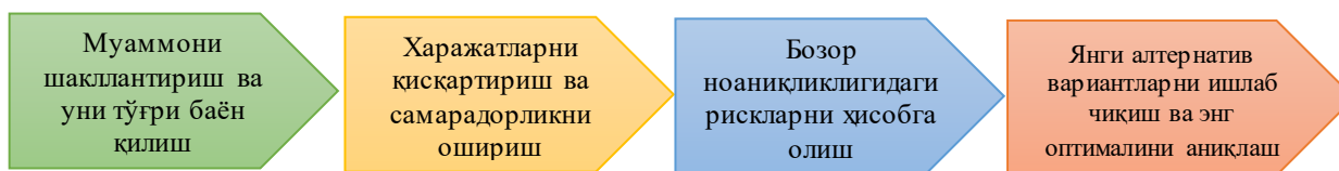
2-расм. Эконометрик моделларни тузишдаги мезонлар 1

Ўз ўрнида эконометрик моделлар бизга саноат объектининг ишлаш хусусиятларини аниқлашда қўл келади ва шу асосда ҳар қандай кўрсаткичлар ўзгарганда унинг келгусидаги ҳаракатини тахмин қилиш мумкин бўлади. Бу эса яхшироқ ва ишончли прогнозни олиш имконини беради. Ҳар қандай ҳудудий саноат тармоғи учун вазиятларни олдиндан билиш қобилияти яхшироқ натижаларга эришишни, йўқотишларни олдини олиш ва хавфни минималлаштиришни англатади. Шундай қилиб, эконометрик модел мезонлари – мақсад, алтернативлар, харажатлар ва самарадорликни ўз ичига олади. Уларнинг ўзаро боғлиқлигини қуйидагича эътироф этиш мумкин (2-расм).