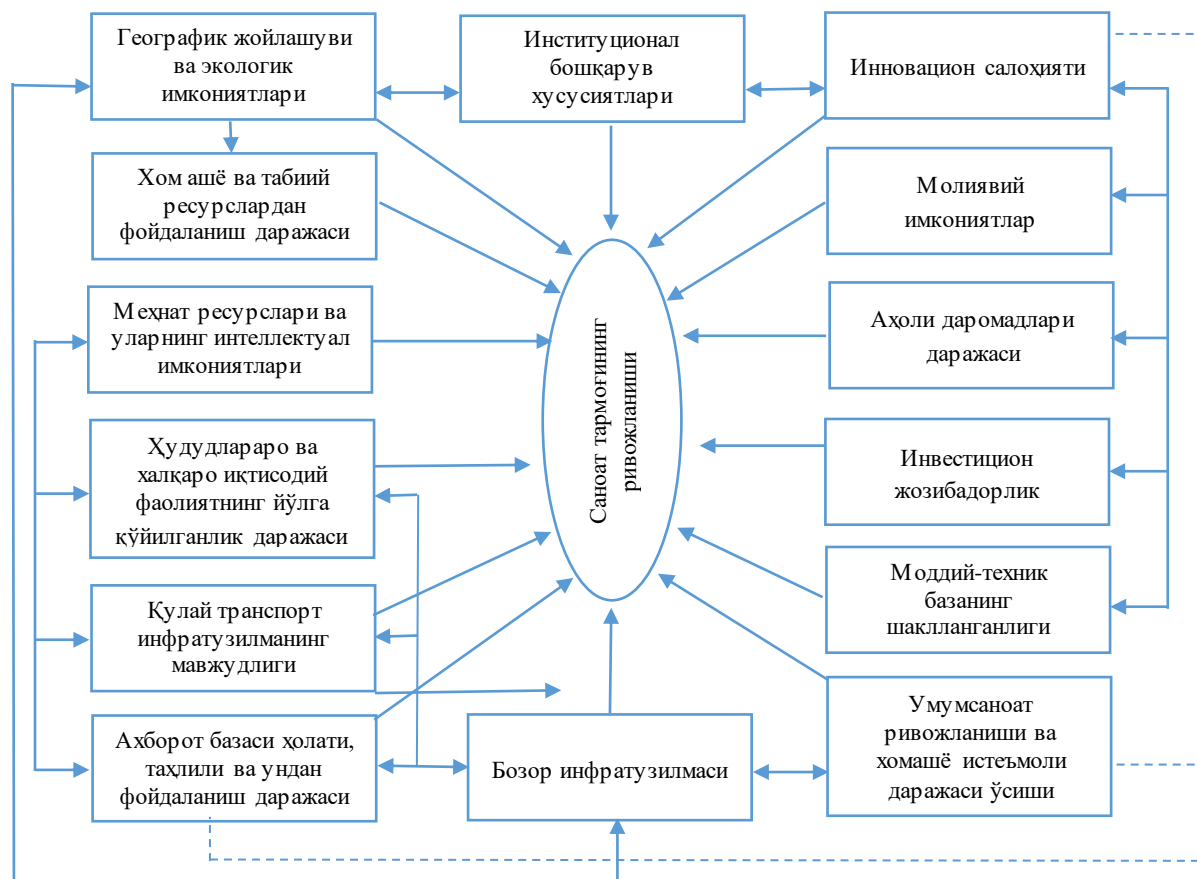
1-расм. Саноат ривожланишига таъсир кўрсатувчи омиллар ва уларнинг ўзаро интеграцияси 1

натижани баён этиш имконига эгадир. Айнан шунинг учун ҳам иқтисодий жараёнларни таҳлил қилишда айрим ўзгарувчи қийматлари асосида бошқа ўзгарувчан қийматларни аниқлаш учун яратилган иқтисодий-математик моделлар кенг қўлланилади.