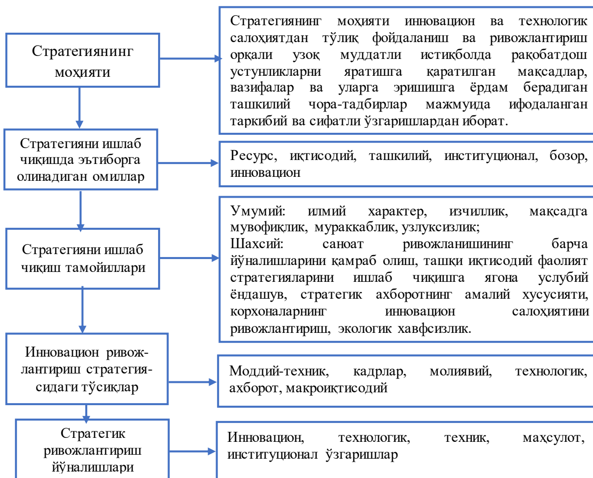
1-расм. Саноат корхоналарини инновацион ривожлантириш стратегиясининг концептуал таркибий қисмлари (муаллиф ишланмаси)

Ҳозирги вақтда омилларнинг охириги икки гуруҳи алоҳида аҳамиятга эга бўлмоқда. Бу рақобат даражасининг ортиб бораётгани, у глобал миқёсга айланиб бораётгани билан боғлиқ. Рақобатбардош позицияни мустаҳкамлаш ва миждозларнинг эҳтиёжларини қондириш учун ишлаб чиқарувчилар ўз фаолиятида инновацион таркибий қисмлардан тобора кўпроқ фойдаланмоқда. Бундай вазиятда стратегияда акс эттирилиши керак бўлган корхонанинг бозор ўрнини тўғри аниқлаш муҳимдир. Стратегияни ишлаб чиқиш ва амалга оширишнинг концептуал асослари 1-расмда келтирилган.