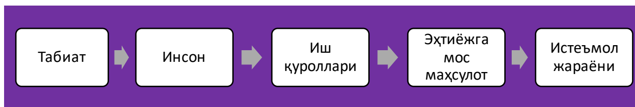
2-расм. Табиат неъматларини истеъмолгача бўлган жараённинг ўзаро кетма-кетлик занжири

Расмдан кўриниб турибдики, биринчи ўринда табиат турибди. Бунда инсон истеъмоли учун барча неъматлар мавжуд. Шу туфайли табиат билан биринчи муносабатга киришадиган инсон саналади. Ҳаётнинг илк даврларида табиат неъматларини асл ҳолда қўл меҳнати билан иш қуролларисиз ўзлаштирилган. Аста-секинлик билан инсонлар кўпайиши, ушбу неъматларни ҳам кўпайтириш заруратига дуч келинган. Оқибатда иш қуролларини яратиш зарурати ҳам пайдо бўла бошлаган. Иш қуролларини яратувчиси – бу ҳам инсон ҳисобланади. Инсон табиатдан иш қуроллари ёрдамида эҳтиёжга мос маҳсулотлар ярата бошлаган ва уларни истеъмол қилган. Шу тариқа табиатдан истеъмолгача бўлган жараён занжири – иқтисодиёт вужудга келган. Ушбу жараёнда иқтисодий муносабатлар ҳам шаклланган. Бу занжирнинг барча босқичларида инсон тафаккури муҳим роль ўйнайди. Ушбу ҳолатдан келиб чиқиб, иқтисодиёт – инсон тафаккури маҳсули , деган хулосага келдик. Инсон учун зарур бўлган истеъмол маҳсулотларини яратиш жараёнида жуда катта ва мураккаб муносабатлар тизими турибди. Бу муносабатларни ишлаб чиқариш муносабатлари , сўнгра иқтисодий муносабатлар , деб аталиши ҳам шу тариқа вужудга келган.