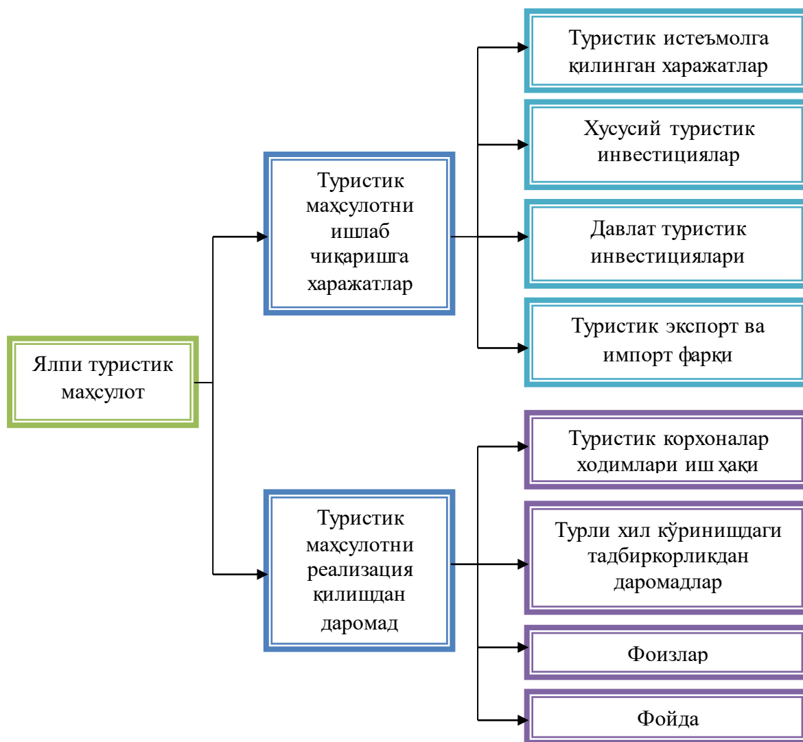
2-расм. Туризм соҳасида ялпи маҳсулотнинг шаклланиши 1

Маълум бир даврда (бир йилда) туризм соҳасида ишлаб чиқарилган товарлар ва хизматларнинг қиймат ҳажми ялпи туристик маҳсулот сифатида аниқланади. Ялпи туристик маҳсулот икки жиҳатдан қараб чиқилади: 1) маълум бир вақтда туристик товарлар ва хизматлар ишлаб чиқариш учун туризм соҳасида қилинган барча харажатларнинг суммаси сифатида; 2) муайян давр учун туристик товарлар ва хизматлар реализациясидан олинган барча даромадлар суммаси сифатида (2-расм).