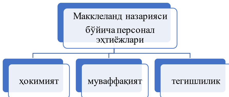
2-расм. Макклеланд назарияси

Олим персоналда бошқаларга таъсир этишга, ўз сўзига эга бўлишга, ўзига бошқаларни диққатини қаратишга ва нотикликка интилиш мавжудлиги айнан унда ҳокимиятга бўлган эҳтиёждан келиб чиқишини таъкидлайди.