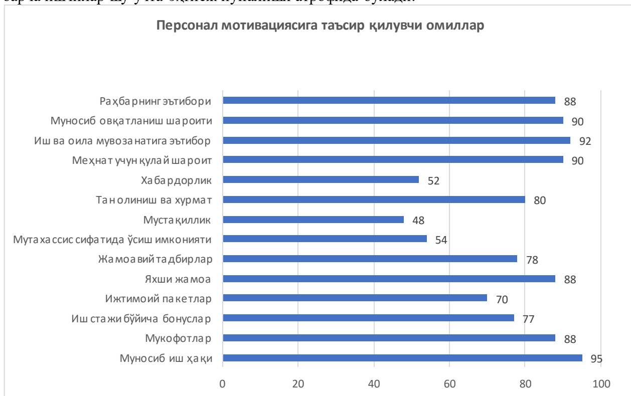
3-расм. "ATLANT TOWELS" МЧЖда персонал мотивациясига таъсир қилувчи омиллар таҳлили

Тегишлиликка эҳтиёж сезадиган персонал жамоасига ғамхўр, ёрдамга ошиқадиган, дўстликни афзал кўрадиган ва бошқа ижтимоий хислатларга эга бўлади. Албатта жамоа яхши шаклланган бўлса, персоналнинг аксарият қисми шу жамоанинг ажралмас қисми бўлишга эҳтиёж сезади. Шу эҳтиёжга асосланиб унга мотивация бериш самарали ҳисобланади. Д.Макклеланд асосан Маслоу пирамидасидаги юқори поғонада турадиган эҳтиёжларга асосланиб мотивация тизимини жорий этишни кўриб чиққан. Унинг фикрича барча ишчилар шу учта эҳтиёж йўналиши атрофида бўлади.