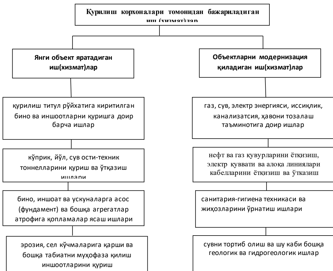
1-расм. Қурилиш корхоналари томонидан бажариладиган иш (хизмат)ларни якуний натижаси бўйича таснифи 1 .

ларининг янги объектлар яратувчанлик коэффициенти” кўрсаткичини аниқлаш ҳамда статистика томонидан қабул қилинадиган “12 корхона шакли”, 1-кб шакли ҳамда 4-кб (қурилиш, савдо, хизмат) ҳисоботларини тўлдириш жараёнида маълум қулайликлар яратади.