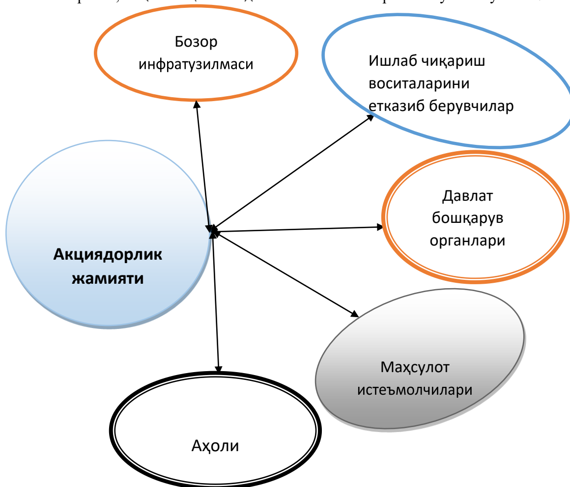
2-чизма. Акциядорлик жамиятининг ташқи муҳити 2

Бу тамойиллар модернизациялаш шароитларида корхона бошқарувини ташкил этиш имкониятларини янада кенгайтиради. Айниқса йирик корхоналарда модернизация жараёнлари мураккаб тизимдан иборат бўлади. Чунки технологик таркибини замонавийлаштириш учун катта маблағ талаб этилади. Ўз навбатида агар бу иш тўла-тўқис амалга оширилса, меҳнат тақсимотида катта имкониятларга эга бўлиш мумкин 1 .