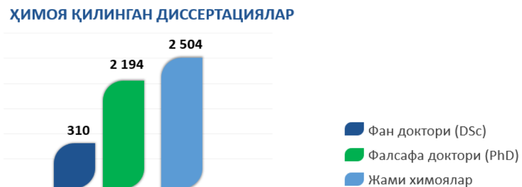
1-расм. 2023 йилда олий таълим муассасаларининг илмий салоҳияти ҳамда ҳимоя қилинган диссертациялар сони 1