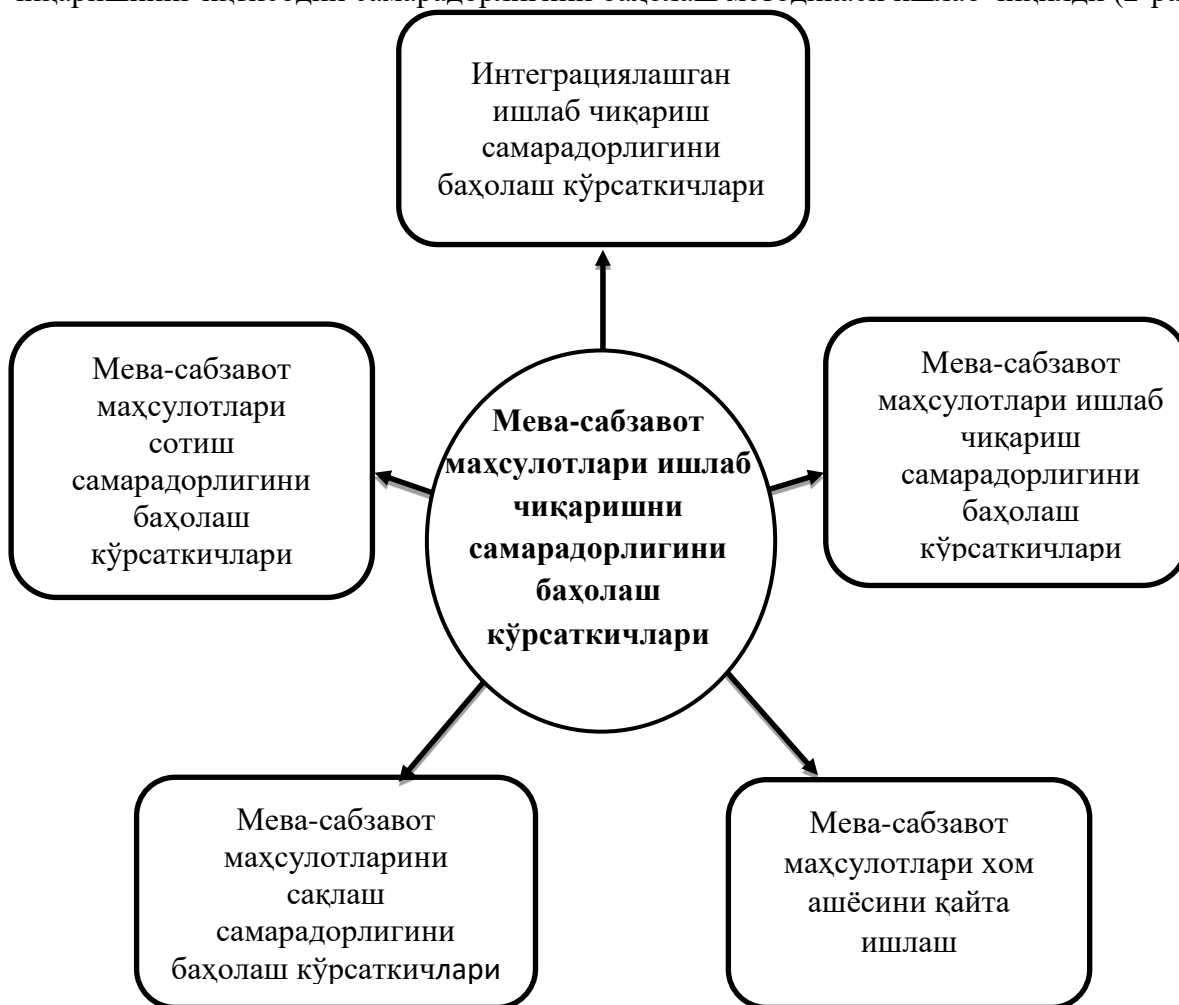
2-расм Мева сабзавот маҳсулотлари ишлаб чиқаришнинг самарадорлигини баҳолаш кўрсаткичлари 1

Олиб борилган тадқиқотлар жараёнида мева-сабзавотчилик маҳсулотларга ишлаб чиқаришнинг иқтисодий самарадорлигини баҳолаш методикаси ишлаб чиқилди (2-расм).