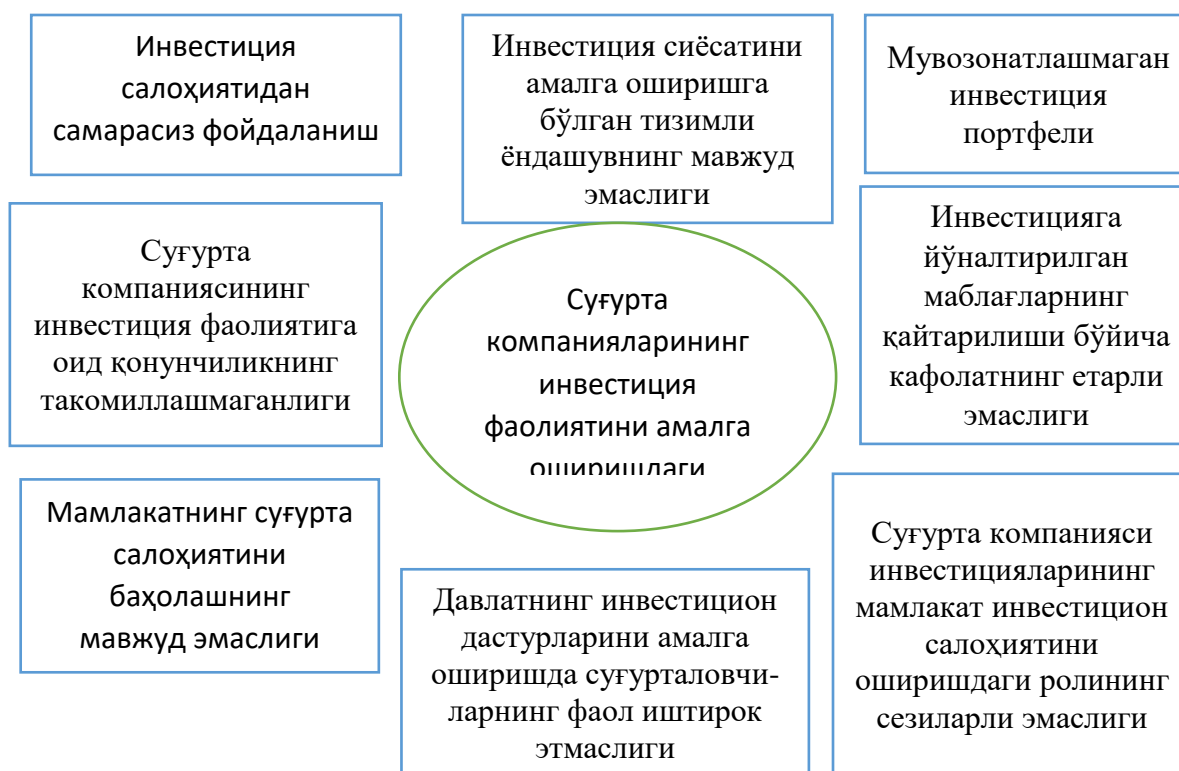
1-расм. Суғурта компанияларининг инвестиция сиёсатини шакллантиришнинг асосий муаммолари 3

Таҳлил ва натижалар. Миллий суғурта тизимида ўрнатилган амалиётни тизимлаштириш суғурта компаниясида инвестиция сиёсатини шакллантиришни такомиллаштиришнинг асосий муаммолари ва йўналишларини аниқлаштириш имконини беради (1-расм).