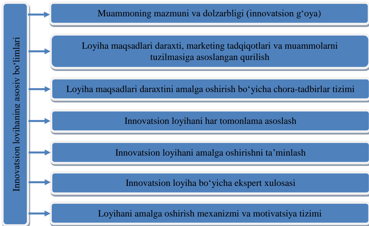
1-rasm. Xizmat ko'rsatish korxonasi innovatsion loyihani realizatsiya qilish bo'limlari 1

Xizmat ko'rsatish korxonasi innovatsion loyihalar samaradorligini tahlil qilish asosida baholash jarayonlari: korxonaning ishlab chiqarish imkoniyatlarini baholash, innovatsiyalar sifat ko'rsatkichlarini tahlil qilish, loyihaning rentabelligini tahlil qilish, innovatsiyalar smetasini tahlil qilish va shakllantirish, texnologik imkoniyatlarni tahlil qilish, korxonaning moliyaviy-iqtisodiy holatini tahlil qilish, xizmat ko'rsatish jarayoni tahlili, bozor tahlili va marketing tadqiqotlari, institutsional va qonunchilik omillarini tahlil qilish, makroiqtisodiy va siyosiy vaziyatni tahlil qilish, tadqiqot va ishlanmalar darajasini baholash bosqichlarini qamrab oladi (2-rasm).