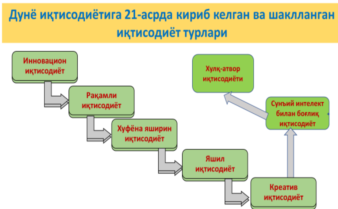
1-расм. Дунё иқтисодиётига XXI асрда кириб келган ва шаклланган иқтисодиётнинг турлари

Таҳлил ва натижалар. Дунё иқтисодиёти кескин ўзгаришлар даврида яшамоқда. Айниқса XXI асрга келиб, асрлар давомида амал қилиб келаётган иқтисодиётнинг турлари бутунлай янги мазмун ва шаклга эга бўлмоқда. Олдин иқтисодиётимиз битта шакл ва мазмунга эга бўлиб, аста-секинлик билан такомиллашиб келган. Эндиликда эса, унинг нафақат мазмуни, балки шакли ҳам ўзгариб бормоқда. Ушбу асрда кириб келган ва шаклланган иқтисодиётнинг турларига назар соладиган бўлсак, буларнинг турлари анча кўпайиб қолди. Буларнинг турлари қуйидаги расмда келтирилган (1-расм).