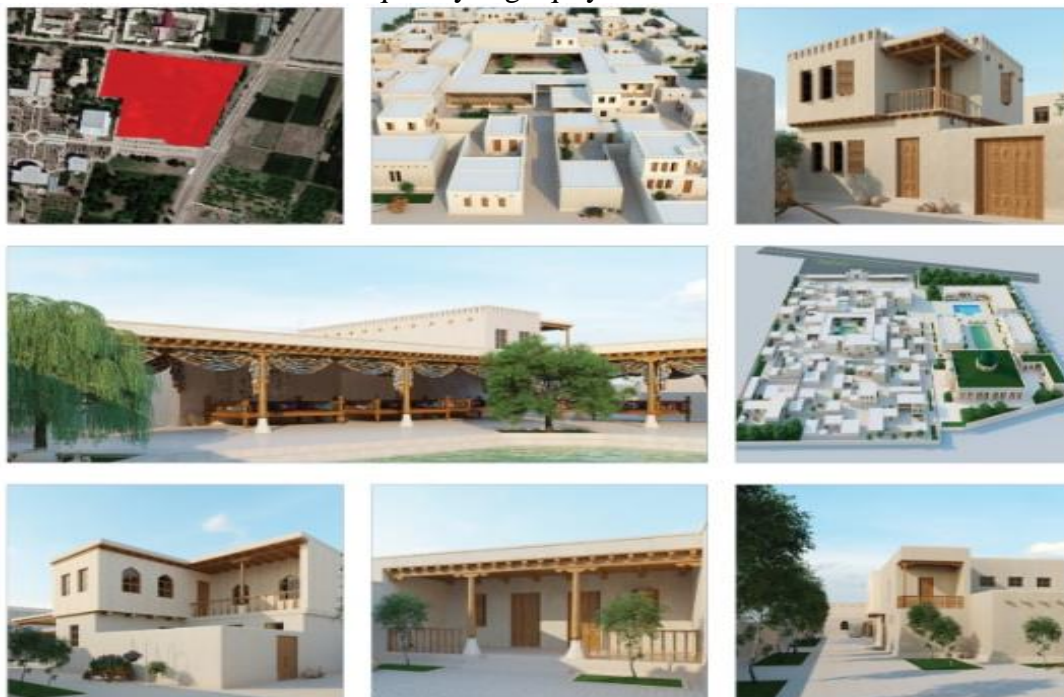
4-rasm. Afshona turizm qishlog‘i negizida tashkil etiladigan turizm shaharchasining umumiy ko‘rinishi

ijtimoiy ko‘makka muhtoj oila vakillari orasidan kadrlar saralab olinishiga qaratiladi. Ahamiyatlisi, agar zarurat bo‘lsa shu yerning o‘zida ularning malakasini oshirib borishga mo‘ljallangan shart-sharoitlari yaratilib, buning uchun Buxoro Davlat universiteti Iqtisodiyot va turizm fakulteti bilan hamkorlik aloqalari yo‘lga qo‘yiladi.