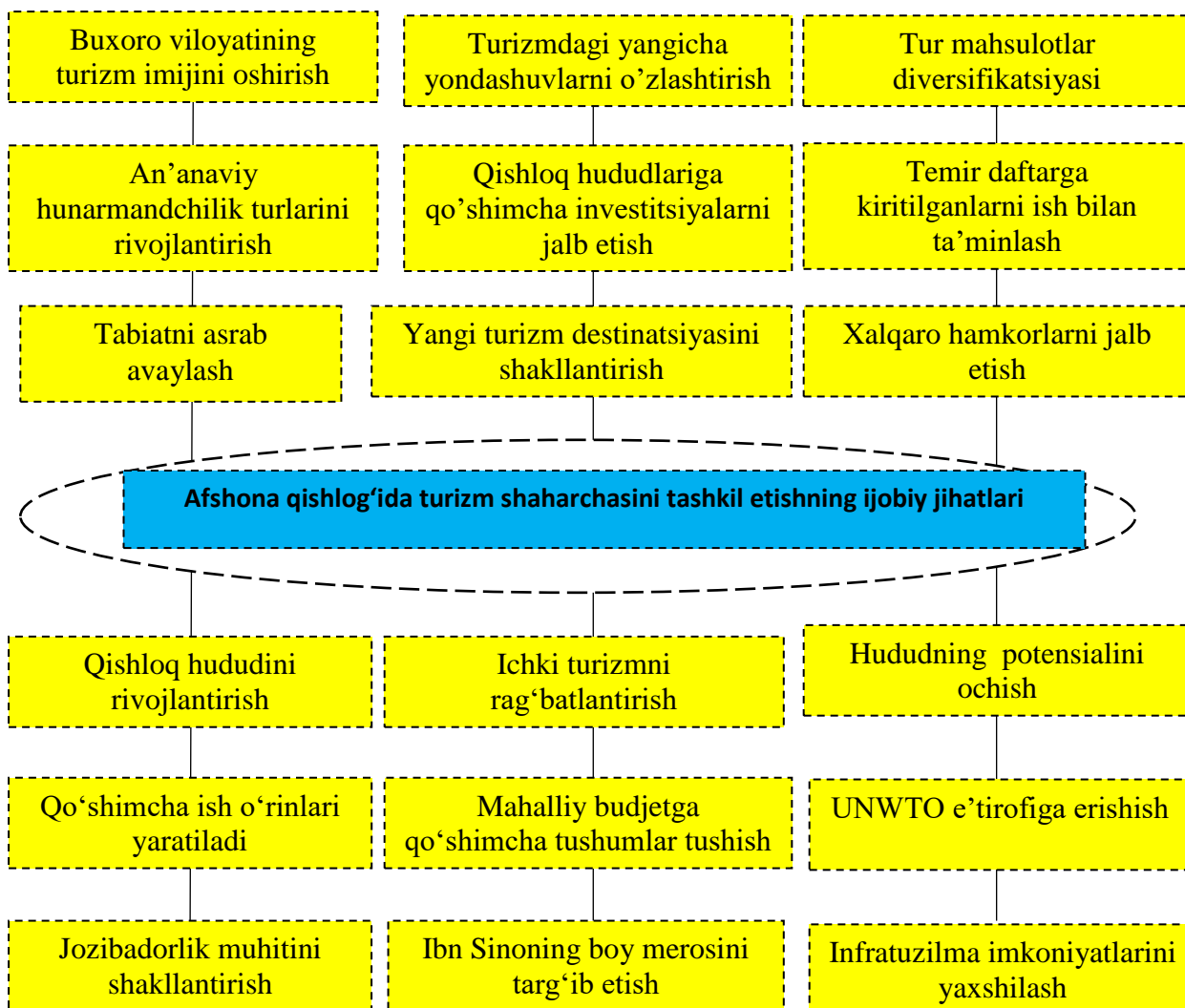
3-rasm. Afshona qishlog'ida turizm shaharchasini tashkil etishning ijobiy jihatlari 2