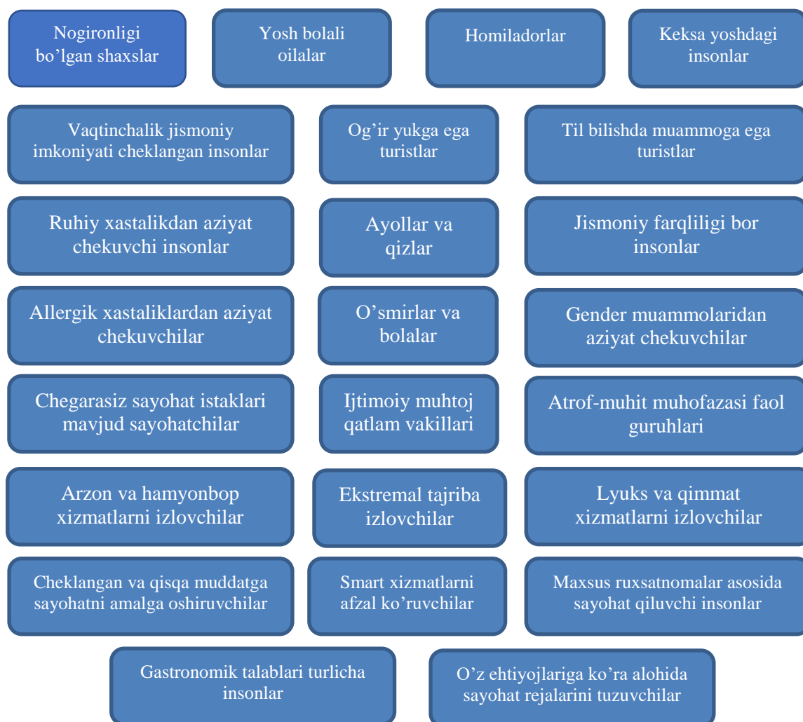
1-rasm. Inklyuziv turizm iste'molchilari segmentining asosiy guruhlar 1

turizm xizmatlaridan ma'lum bir sabablar, xoh u tabiiy, xoh sun'iy shakllangan omillar tufayli bo'lsin foydalana olmayotgan iste'molchilar guruhlariga qaralib, aynan ularning talablarini qondirish imkoniyatlarini shakllantirish ustuvor vazifa sanaladi.