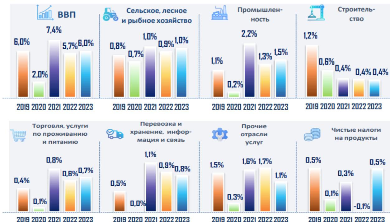
Рис. 1. Динамика вклада отраслей и прирост ВВП, в % к итогу

видам экономической деятельности который изложен в рис. 1 ниже.