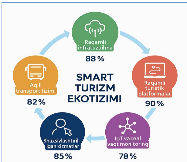
2-rasm. Smart turizm ekotizimlarining samaradorlik darajasi