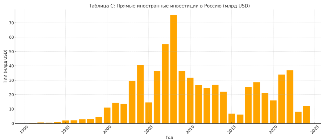
Таблица 2: ПИИ в Россию (млрд. долл. США)

В таблице 2. показано, что потоки ПИИ в Россию демонстрируют значительные колебания в зависимости от политической стабильности и уровня внешнеэкономических санкций. Периоды реформ и роста характеризуются притоком капитала, в то время как кризисы и санкции приводят к оттоку инвестиций.