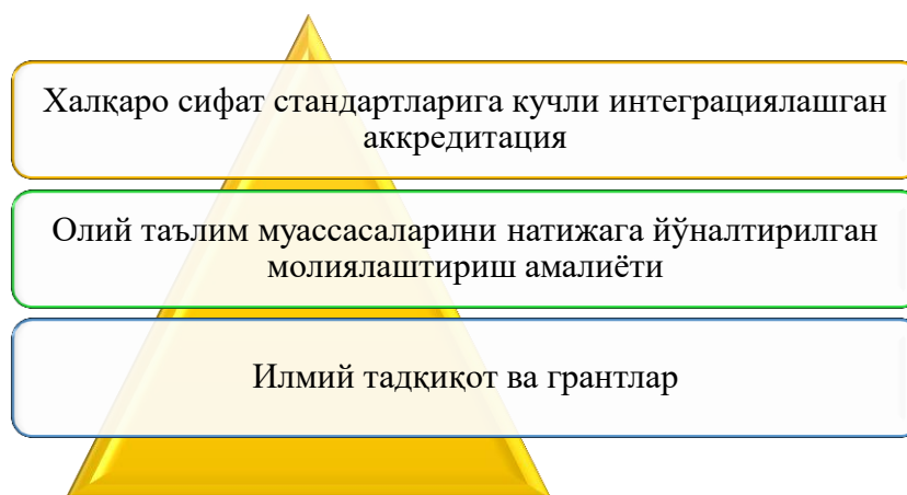
3-расм. АҚШда олий таълим хизматлари сифатини оширишнинг ташкилий-иқтисодий механизми самарадорлигини таъминлаш таркибий элементлари 1

кейинги даврда уни молиялаштириш ҳажми олий таълим муассасасининг фаолияти самарадорлигидан келиб чиққан ҳолда белгиланиши амалиёти шаклланган бўлиб, ушбу амалиёт олий таълим муассасалари томонидан олий таълим хизматлари сифатини мунтазам ошириб боришга қаратилган “қатъий сифат интизоми” шаклланиши билан биргаликда, маҳаллий олий таълим хизматлари бозоридаги рақобат кураши глобал даражадаги рақобат даражасидан ҳам кучли даражада ривожланишига сабаб бўлган;