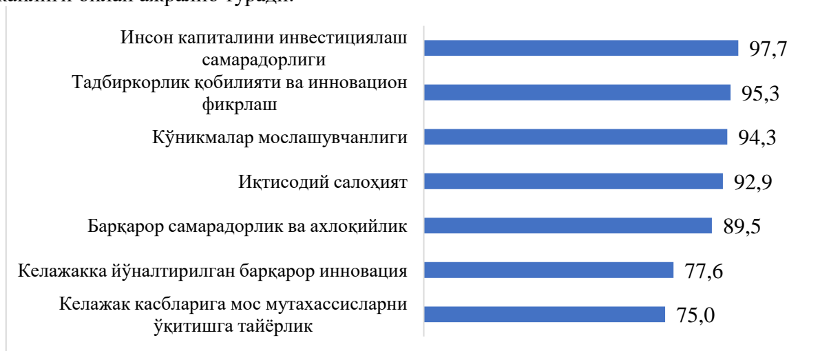
4-расм. АҚШ олий таълим хизматлари бозорида хизматлар сифатини ошириш устуворликлари (олий таълим хизматлари сифати билан кўрсаткичлар ўртасидаги боғлиқлик даражаси, фоизда, 2025 й.) 2

турли йўналишдаги тадқиқотлар учун грантлар – АҚШ олий таълим муассасалари глобал даражада илмий фундаментал ва амалий грантларни амалга ошириш, улар асосида эришилган натижаларни амалиётга жорий этиш ва илмий тадқиқот ишларини тижоратлаштириш бўйича етакчилиги билан биргаликда, юқори рақобатбардошликка эга эканлиги билан ажралиб туради.