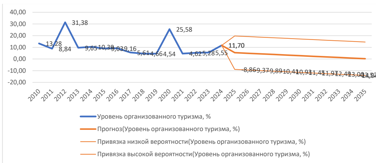
Рис.3. Прогнозирование уровня организованного туризма в Узбекистане до 2035 года на основе сценарного моделирования

На основе результатов PEST анализа применим метод Дельфи, основанный на учете мнения экспертов, функционеров в туроператорской деятельности.